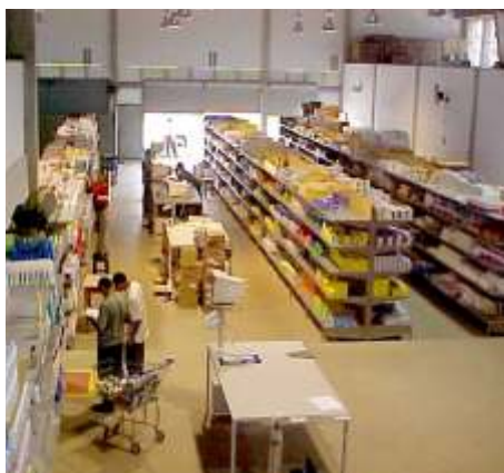
A área de atuação da empresa abrange todo o estado do Espírito Santo.