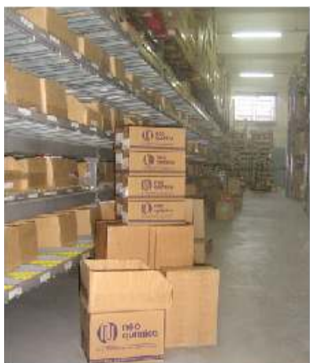
O depósito funciona com moderna estrutura de flow-racks.