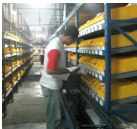
A empresa conta com moderna estrutura de flow-racks desde junho de 2006