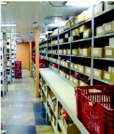
O depósito passou por uma completa modernização no início de 2006.